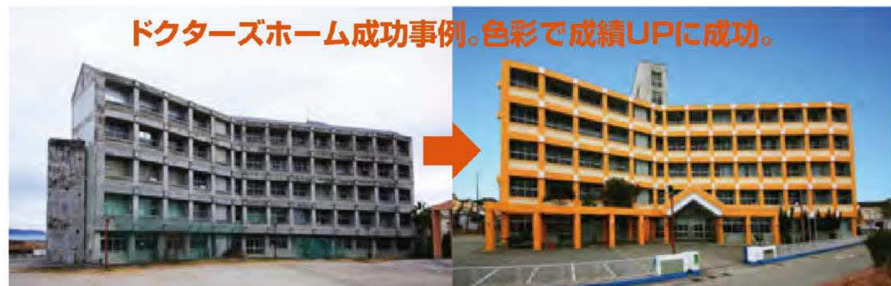
ドクターズホーム成功事例。色彩で成績UPに成功。